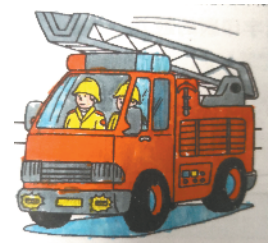
小记者:李雨轩 证号:210270 周口五一路小学三(5)班