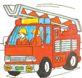
小记者:李嘉睿 证号:210190 周口五一路小学二(3)班