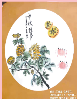
小记者:石佳鑫 证号:210206 周口五一路小学二(5)班