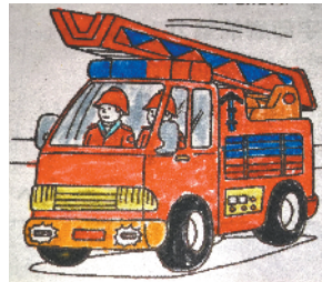
小记者:李艾轩 证号:211043 周口闫庄小学三(1)班