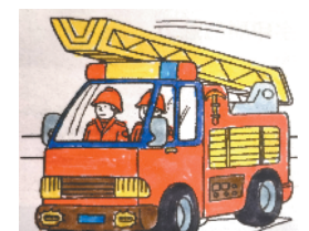
小记者:田康辰 证号:211792 周口莲花路小学二(1)班