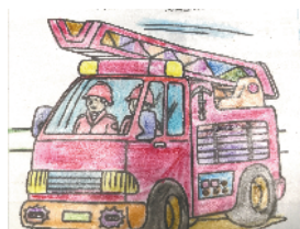
小记者:孙文悦 证号:210520 周口李庄小学二(4)班