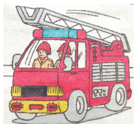
小记者:马康雅 证号:210239 周口五一路小学三(5)班