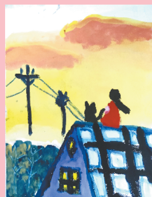
小记者:张书航 证号:210259 周口五一路小学三(1)班

本栏目刊发小记者的书法、绘画、摄影等作品。小记者如果有这些爱好,快快行动起来吧!作品完成后,请用相机拍下来并发送到zkwbxjz@126.com。