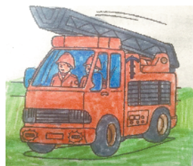
小记者:田浩远 证号:210212 周口五一路小学二(5)班