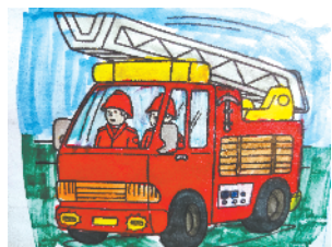
小记者:滕若伊 证号:212150 周口六一路小学三(1)班