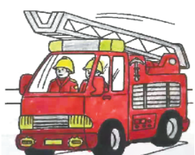
小记者:宋子晨 证号:210495 周口李庄小学二(3)班