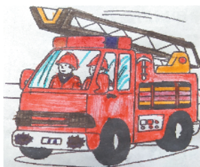
小记者:张越涵 证号:210490 周口李庄小学二(3)班