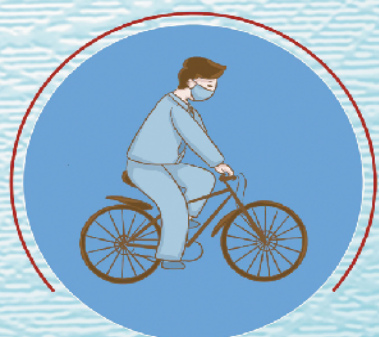
少使用公共交通工具