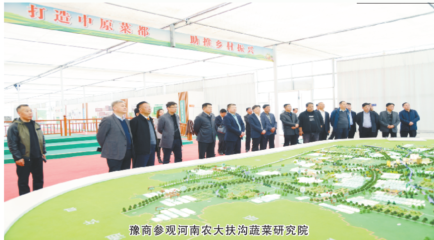
豫商参观河南农大扶沟蔬菜研究院