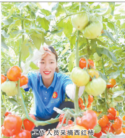
工作人员采摘西红柿