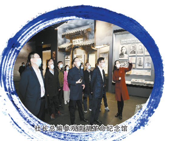
社长总编参观南湖革命纪念馆

“没想到普通的寝具也可以被注入科技动能,实现‘冬暖夏凉’,让人舒适感倍增。在大云镇中德生态产业园,我们看到了一个小乡镇通过自身奋斗实现转型升级,令人叹服。”参观了位于中德生态产业园内的嘉兴福气温控床有限公司,来自全国各地的社长、总编们连连称赞。③8