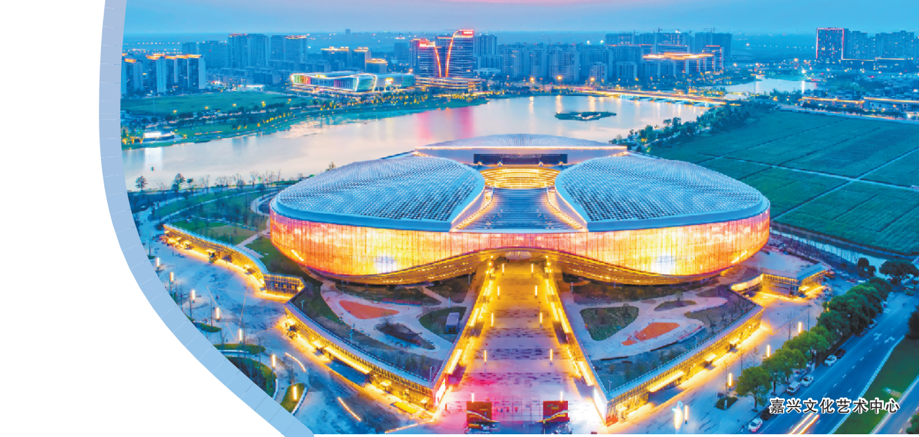
嘉兴文化艺术中心