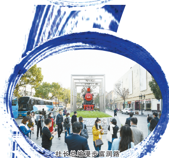
社长总编漫步富润路