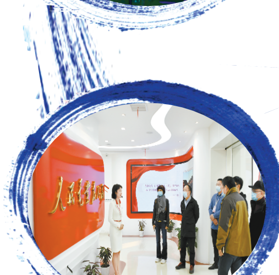
社长总编走进电力红船党员服务队