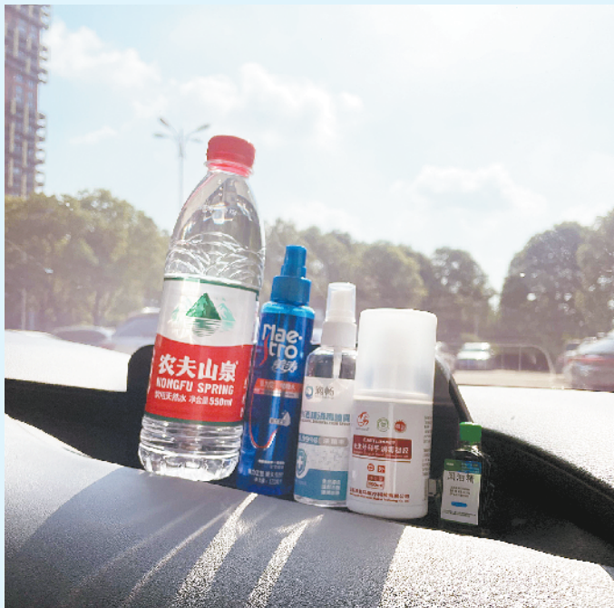
高温下不建议放置在车内的部分物品