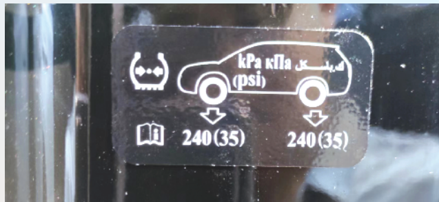
汽车上的推荐胎压标识