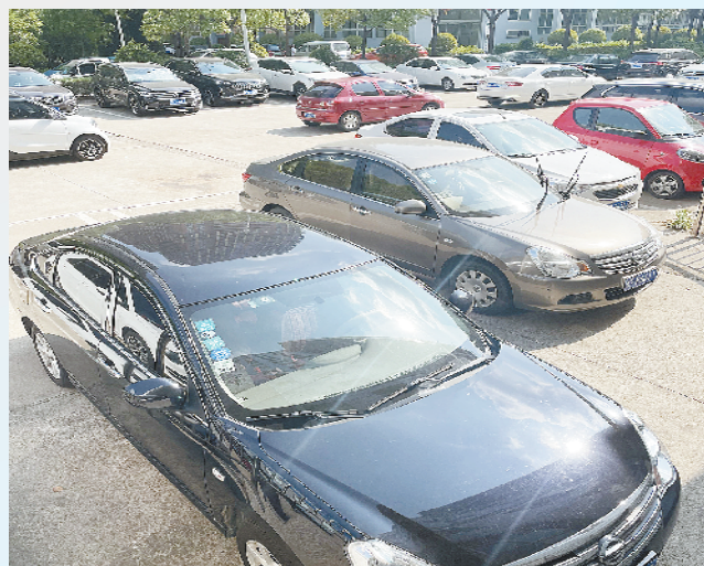
烈日下的户外停车场

夏季汽车养护是一项细致的工作，细心呵护才能延长爱车的使用寿命，避免意外情况发生。有了专业人士的分析指导，夏季高温天气下如何保护爱车的这些技巧，还请您谨记。