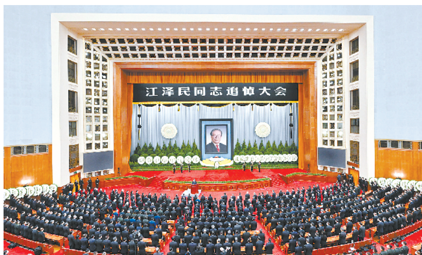
上图:12月6日,中共中央、全国人大常委会、国务院、全国政协、中央军委在北京人民大会堂隆重举行江泽民同志追悼大会。