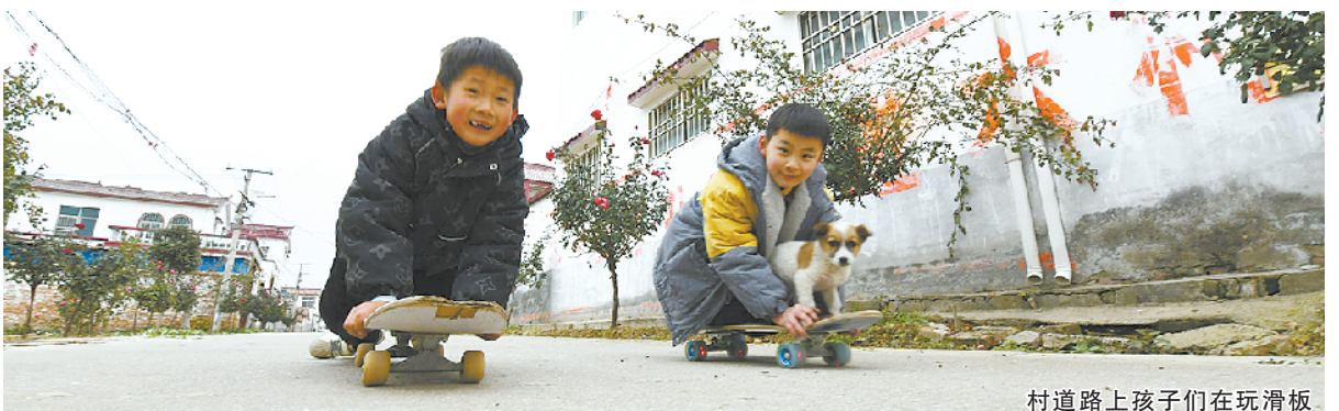
村道路上孩子们在玩滑板