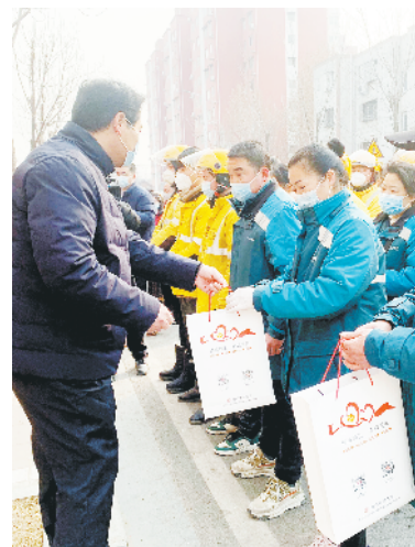
爱心物品发放现场