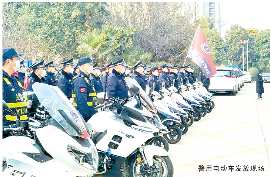
警用电动车发放现场