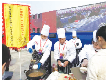
参加第四届逍遥胡辣汤大赛的选手正在紧张有序地制作胡辣汤。