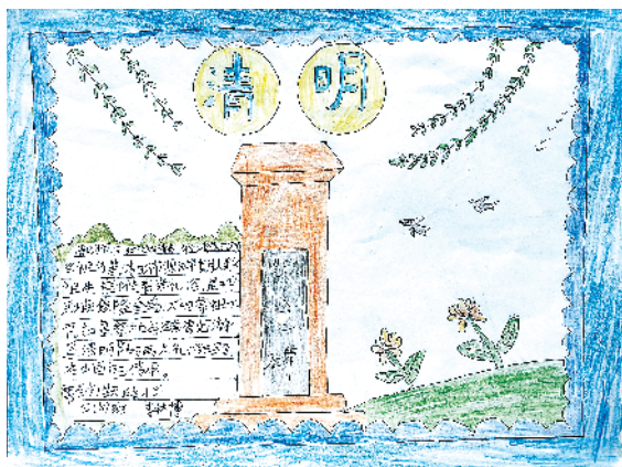
小记者:李林博 四(5)班 (辅导老师:吴艳侠)