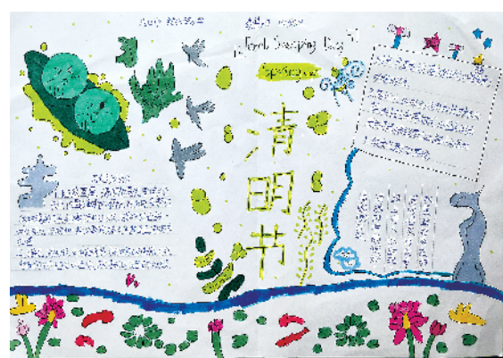
小记者:李慧珂 四(5)班 (辅导老师:吴艳侠)