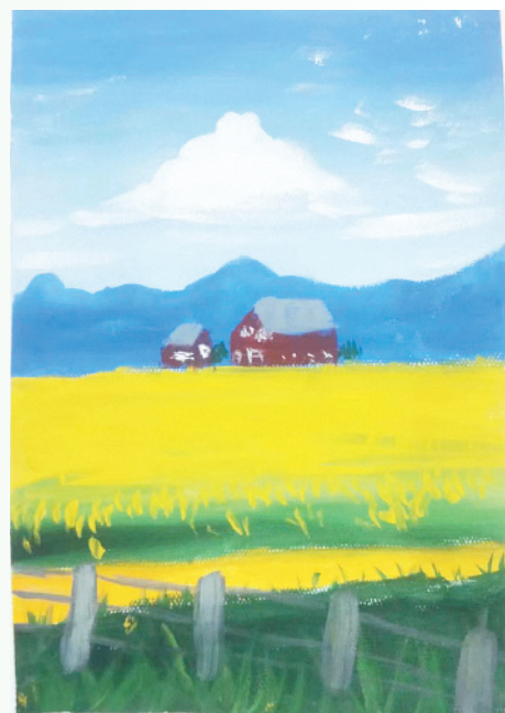
小记者:莱菲尔 周口市六一路小学三(3)班 (辅导老师:孙鲲鹏)