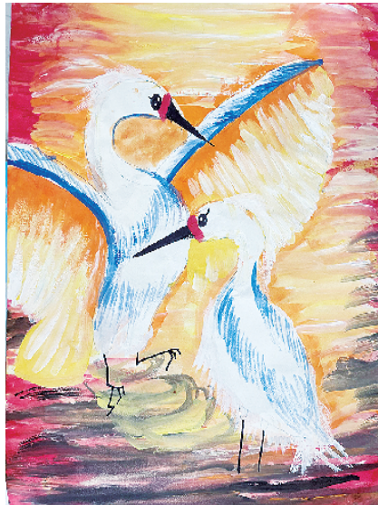
小记者:王潇冉 周口市纺织路小学二(1)班 (辅导老师:张惠惠)