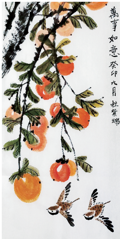
小记者:杜紫瑞 周口市实验学校三(5)班 (辅导老师:康明威)