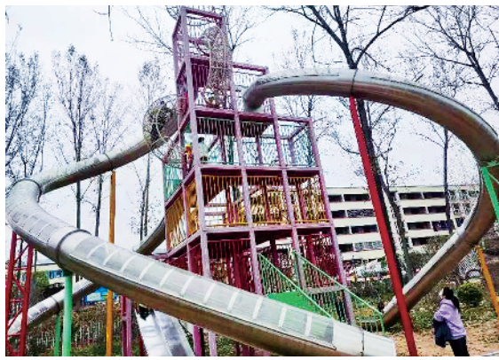
沙颍半岛风景区“时空隧道”滑梯。