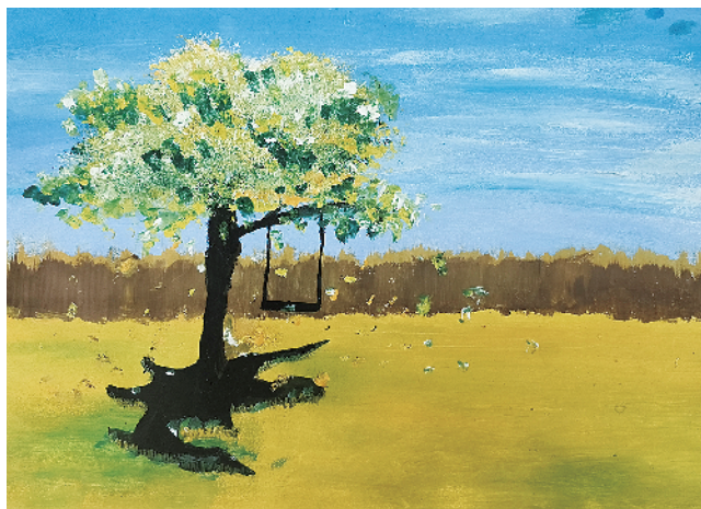
小记者:刘一钡 五(4)班 (辅导老师:樊琰琰)