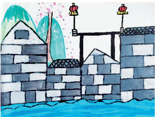
小记者:赫佳乐 周口市六一路小学五(7)班 辅导老师:郭孟华