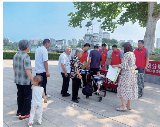
市国动办在周口公园开展垃圾分类宣传活动。