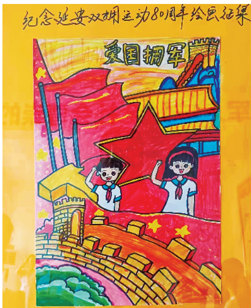
小记者:徐璐玥 周口市六一路小学二(1)班 辅导老师:李娜