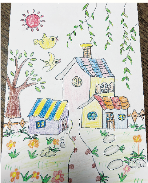
小记者:朱梦希 周口市汉阳路学校二(2)班 辅导老师:周二敏