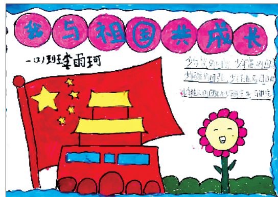
小记者:李雨珂 一(2)班 辅导老师:马彩霞