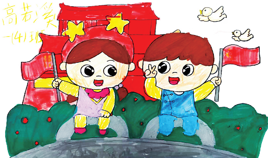
小记者:高若溪 一(4)班 辅导老师:李千惠