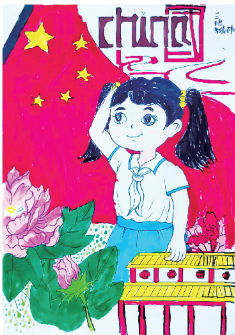
小记者:齐婧玮 一(2)班 辅导老师:马彩霞