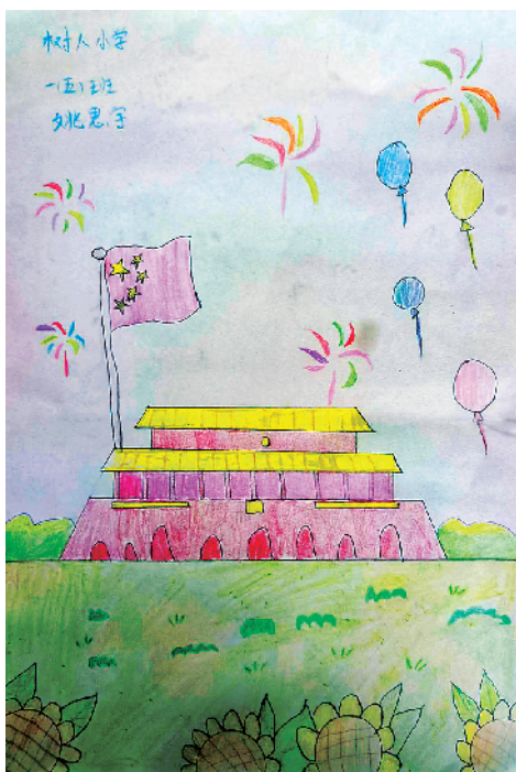
小记者:姚思宇 一(5)班 辅导老师:闫泽惠