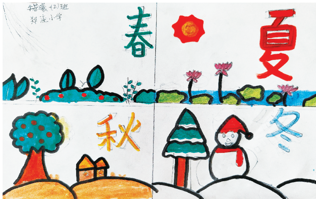
小记者:牛若曦 一(2)班 辅导老师:何俊红