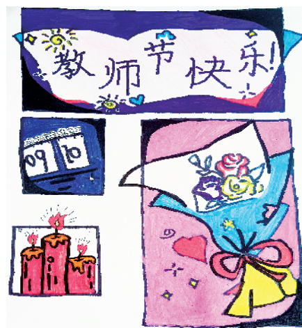
小记者：尹米诺 周口市汉阳路学校三(5)班 辅导老师：孙成荣