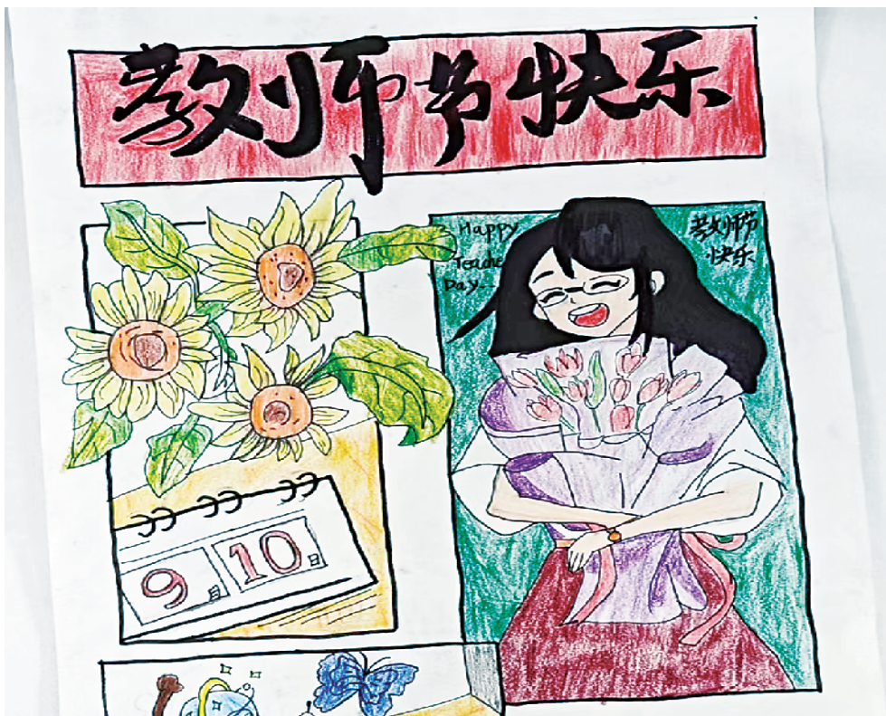
小记者：李皓轩 周口市纺织路小学四(4)班 辅导老师：阮伟