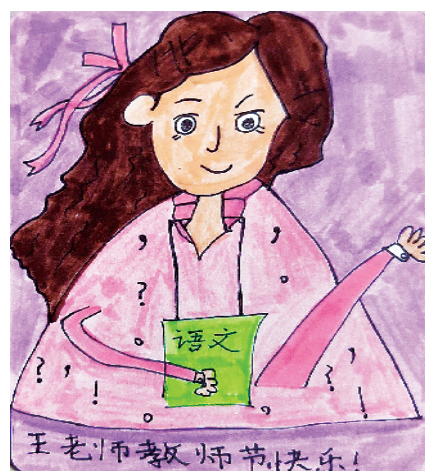
小记者：白哲源 周口市示范区扶沟路小学二(1)班 辅导老师：张艳梅