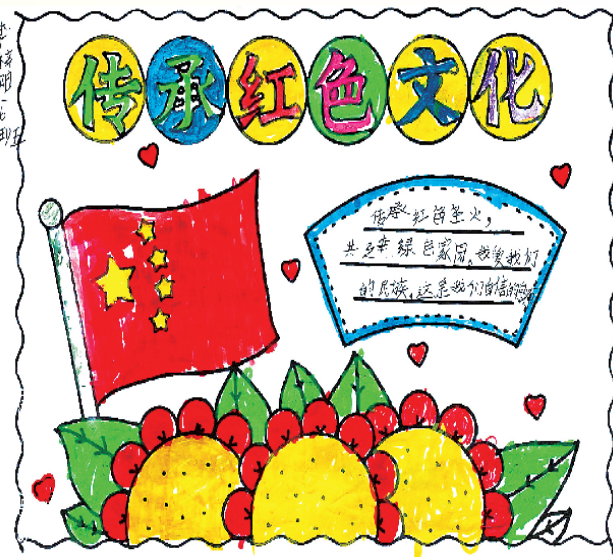
小记者：李梓阳 沈丘县树人小学一(6)班 辅导老师：王晓茜