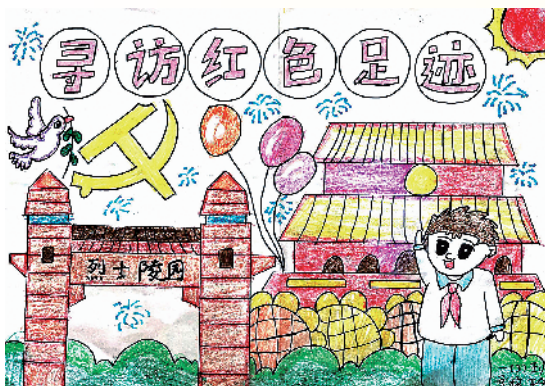
小记者：赵珈萱 沈丘县树人小学一(5)班 辅导老师：闫泽惠