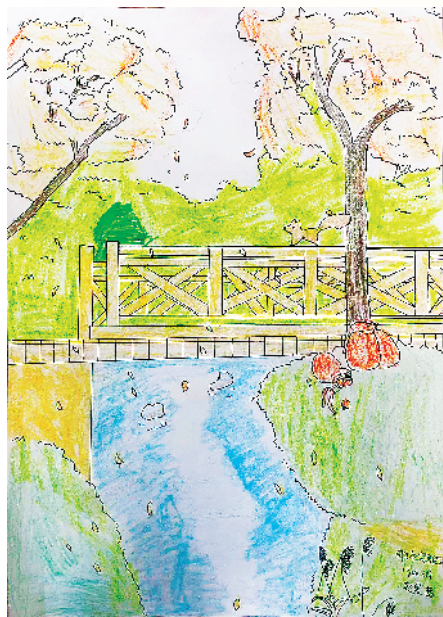
小记者:赵晨茜 四(4)班 辅导老师:徐玉萍