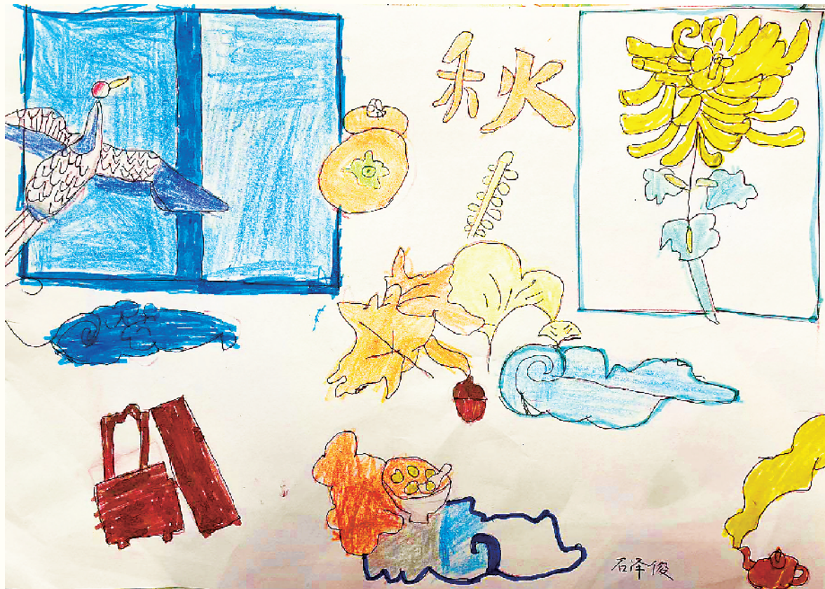
小记者:石泽俊 四(4)班 辅导老师:徐玉萍