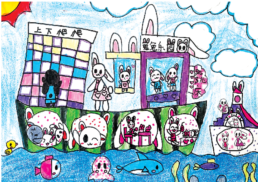
小记者:郭羽玥 沈丘县新区实验小学二(6)班 辅导老师:翟丽