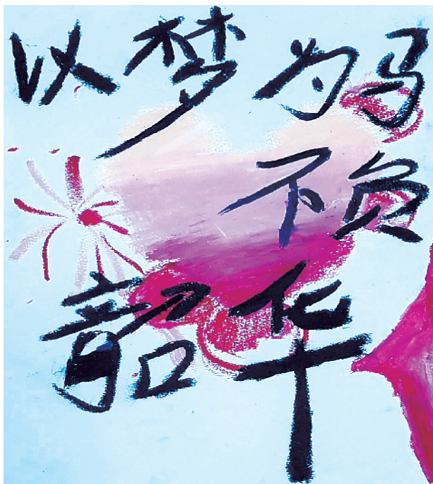
小记者:王锦蕊 商水县直第二小学五(7)班 辅导老师:马丹