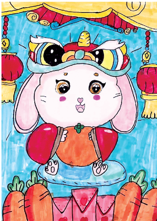
小记者:赵念熙 一(2)班 辅导老师:赵紫涵