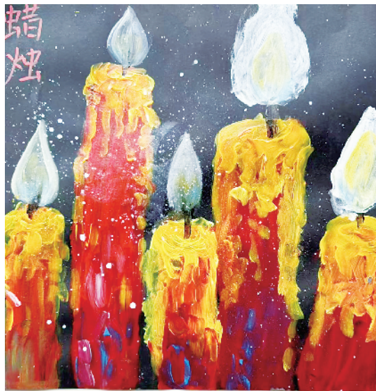
小记者:刘崇瑶 一(6)班 辅导老师:李小玉