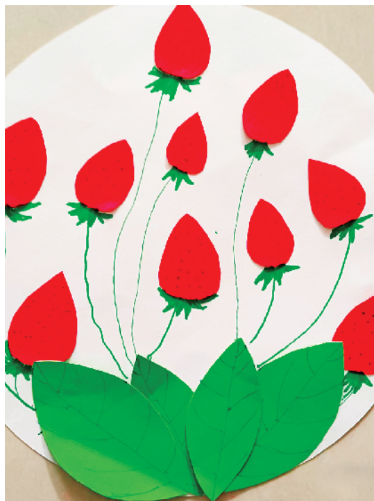
小记者:徐钧泽 一(7)班 辅导老师:李娜