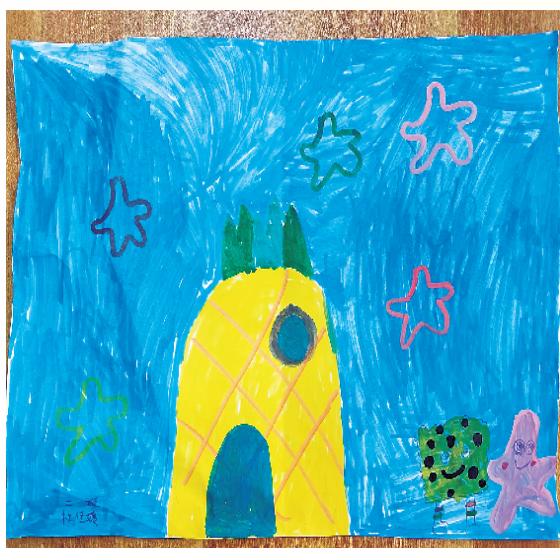
小记者:杜佳媛 二(1)班 辅导老师:王敏杰