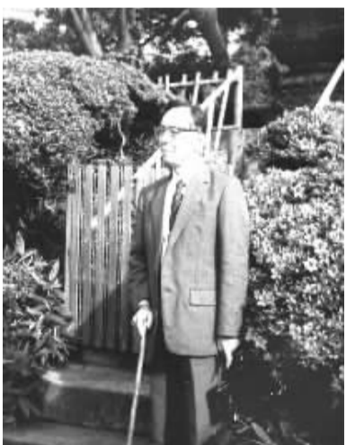
将于7月13日至7月15日期间在国家图书馆总馆南区学术报告厅设置灵堂,供社会各界人士吊唁。7月17日上午,将在北京八宝山殡仪馆东礼堂举行任继愈先生遗体告别仪式。

任继愈先生长期从事中国哲学、宗教学的的教学和研究,用马克思主义立场、观点、方法研究中国哲学,学术成就卓越,影响深远。他筹建了中国第一所宗教研究机构,培养了几代中国哲学史和宗教学研究人才。任国家图书馆馆长以来,任继愈先生积极推进图书馆建设,为繁荣发展国家图书馆事业做出了重大贡献。为悼念任继愈先生,国家图书馆