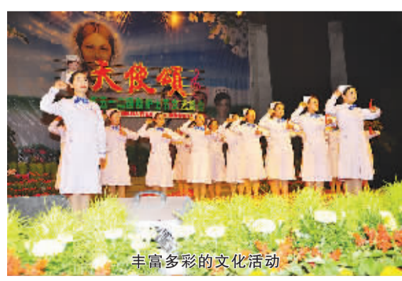
丰富多彩的文化活动