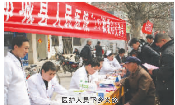
医护人员下乡义诊