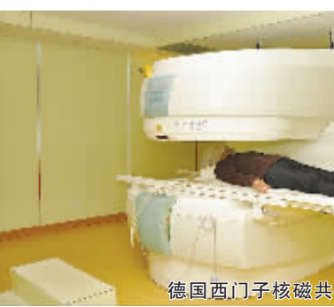
德国西门子核磁共振