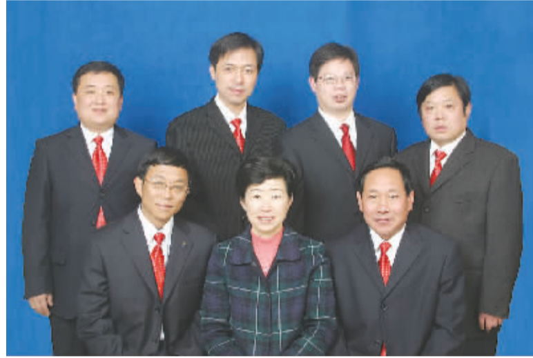
团结、和谐、精干、高效的医院领导班子

疗治疗仪、激光美容仪、冷光牙齿美白仪、胰岛素泵等疗效好、效益佳的中小型设备,实现建院史上基础设施的最大跨越。