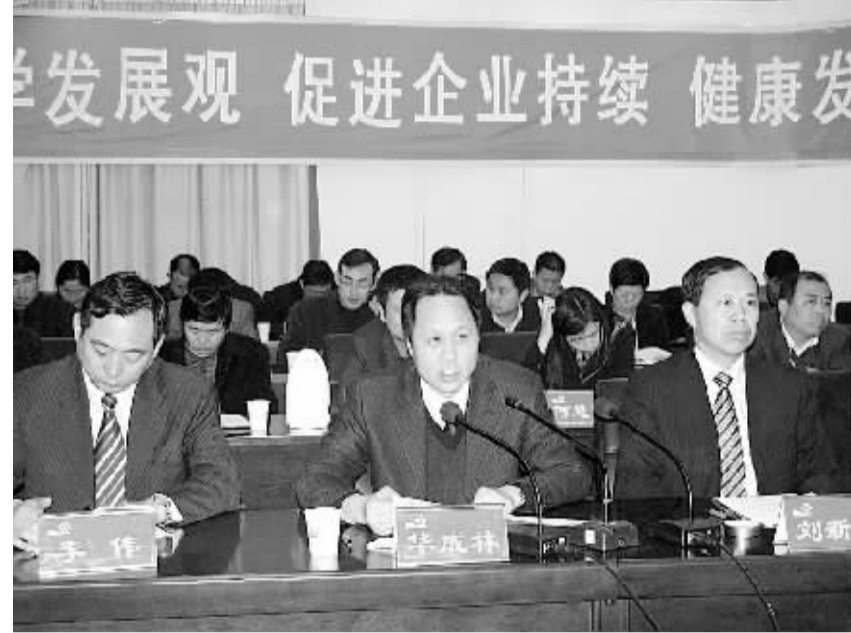
周口联通公司召开“落实科学发展观”主题教育活动

2008年12月3日,原周口联通、周口网通重组合并为中国联合网络通信有限公司周口市分公司(简称周口联通),负责周口行政区域内通信公众网的建设和运营。目前主要经营固定电话、移动通信、宽带和小灵通等基本电信业务和电信增值业务;具有固定电话网、移动电话网、宽带互联网,是周口业务最全、网络覆盖最广、技术力量最雄厚的主体通信运营商。