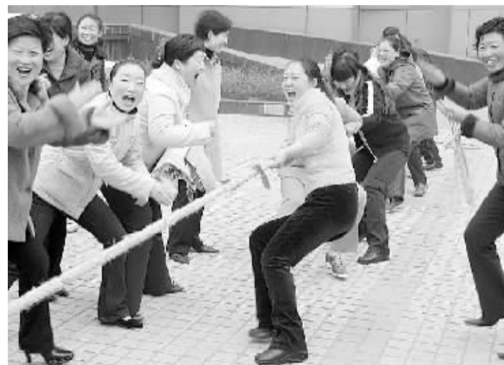
丰富多彩的职工体育文化活动

2009年周口新联通全年投资预算总额近3亿元,主要用于建设基础传送网、宽带IP网和移动业务网络。宽带IP网新增10万线接入端口,GSM网络2009年新建330个基站,2009年新建3G的WCDMA网络90个基站。通过不懈努力,保证我市各个领域的信息化水平大幅度快速提升,为我市又好又快发展做新的更大贡献。