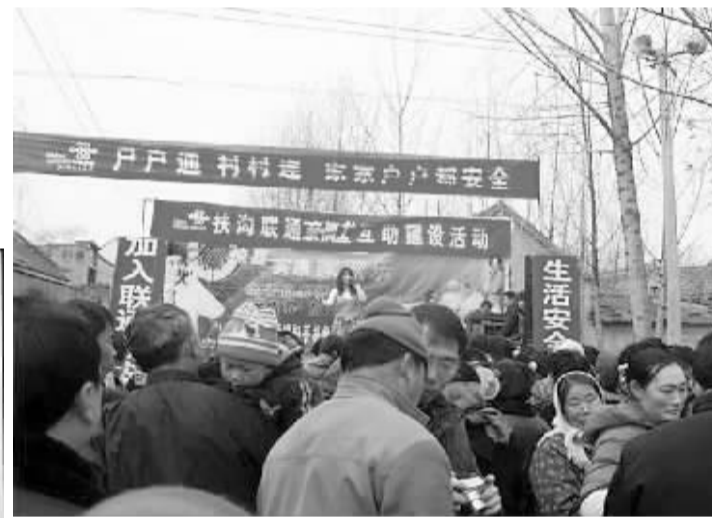
周口联通工作人员深入基层服务“三农”建设