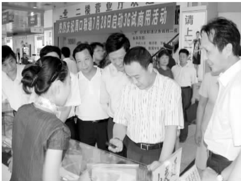
市委书记毛超峰,市委常委、副市长范明在周口联通公司视察工作