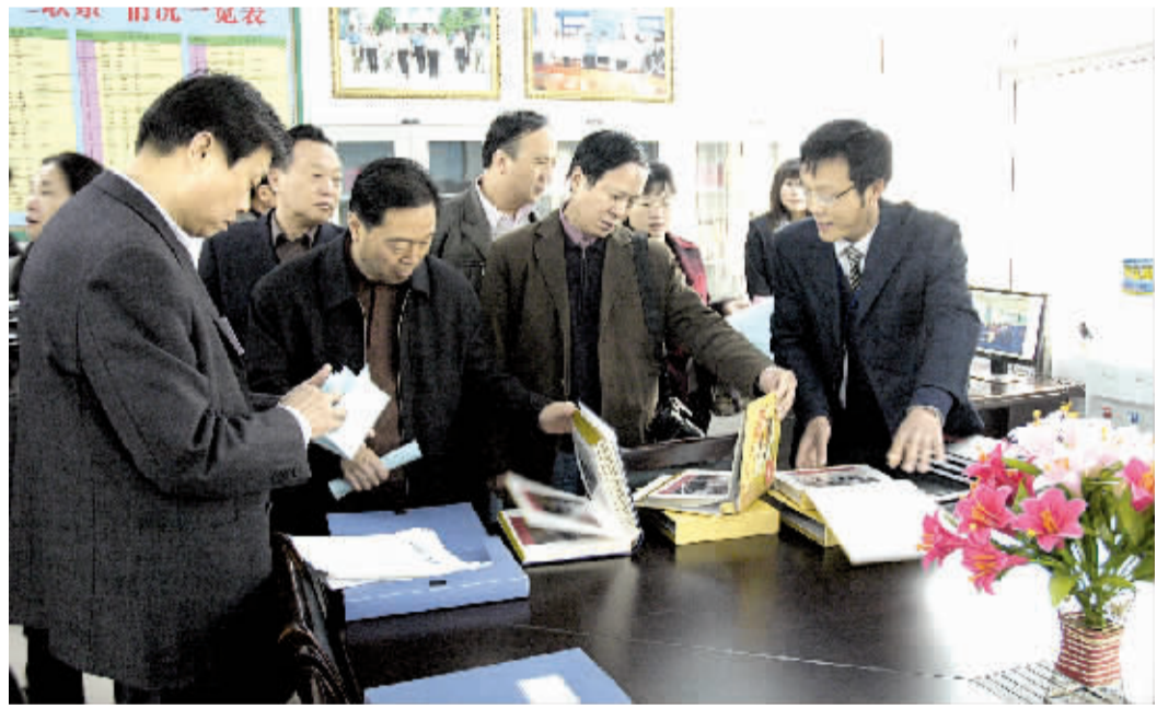
西华县人大深入开展“五保障、五带头、三联系、两提高、一送职”活动,倾听民声,反映民意,充分发挥了基层人大代表作用。图为省人大代表正在参观该县的基层代表活动室。