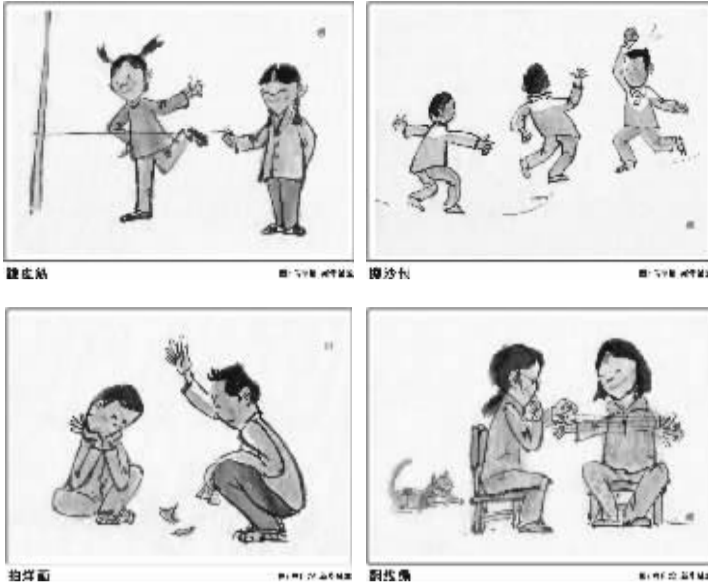
新华漫说·儿时的“六一”

“在祖国的蓝天下幸福成长——各族儿童欢庆‘六一’主题活动”丰富多彩:儿童安全应急体验中心,让孩子们掌握应对自然灾害、公共安全等方面的安全应急知识;“手拉手共绘美好未来”,表达各族儿童对民族团结进步、共建共享和谐社会的幸福愿望……各族儿童沉浸在一片欢乐的海洋。