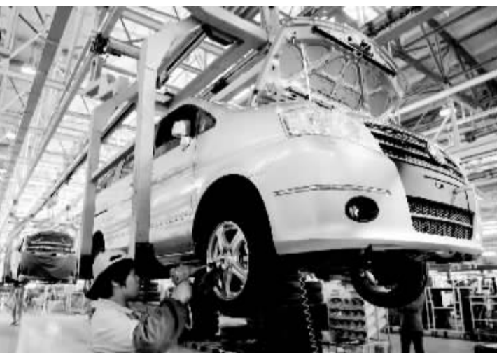
河南打造中原汽车工业基地 11月4日,工人在海马福仕达汽车生产线工作...