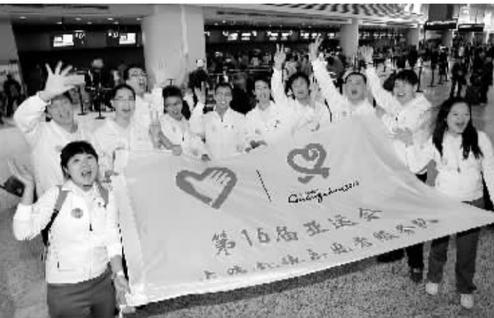
世博志愿者踏上服务亚运会征程 11月4日,赴广州参加亚运会服务的世博会志愿者在机场合影留念...