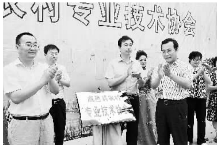
7月12日上午,鹿邑县农技协会揭牌仪式隆重举行。中国科协秘书长李彦捷,省科协副主席、省农技协理事长梁留科,市科协副主席杨国安,鹿邑县领导朱良才、梁建松、李建华、杨彩、鲍远光等共同为鹿邑县农技协会揭牌。