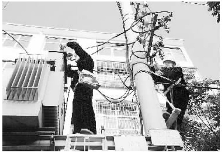
县电业局线路维修人员在抢修一处变压器。近日,县城南关中医院处变压器发生故障,造成线路跳闸。该局立即组织人员在高温条件下投入抢修,仅用1小时20分钟,就恢复了对周边用户的供电。

者,依据相关部门行政处罚意见予以关闭。要加强日常监管,通过相关部门主动监测和群众举报,加强对互联网医药信息服务内容特别是低俗内容和虚假信息内容进行监管,构成犯罪的,移送公安部门,追究刑事责任。 加大宣传力度,鼓励公众监督。要组织主流媒体和互联网站广泛宣传开展互联网药品信息服务专项整治行动的意义和取得的成效,强化曝光谴责机制,鼓励公众监督,发动群众举报,形成全县范围内整治网上药品信息服务低俗和虚假信息专项行动的强大舆论声势。