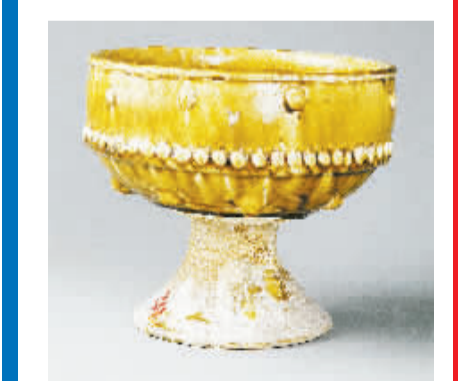
唐代黄釉乳丁纹豆