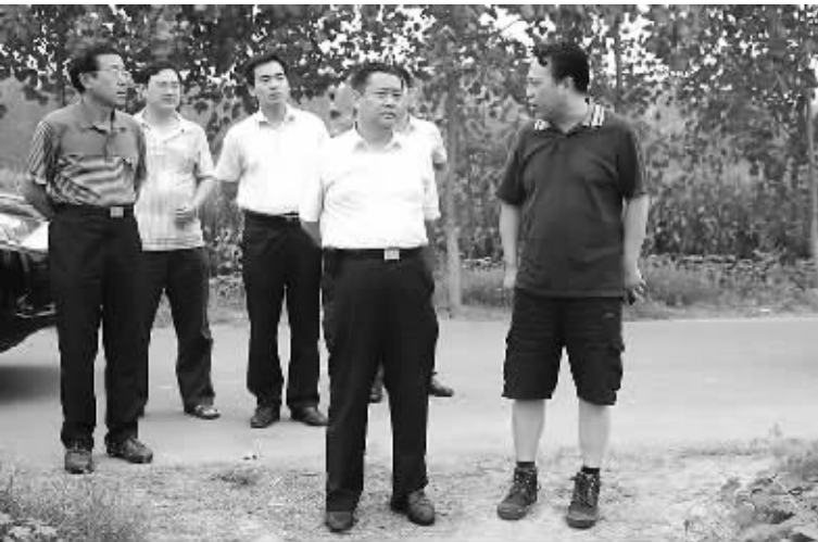
市政府党组成员、市公安局局长姚天民在扶沟调研指导“打四黑除四害”专项行动。

以打击整治“黑作坊”、“黑工厂”、“黑市场”、“黑窝点”为重点的打“四黑”除“四害”专项行动开展以来,全市公安机关高度重视,认真按照省公安厅和市委、市政府的部署要求,紧紧抓住线索摸排、案件侦破等关键环节,以打团伙、端窝点、摧网络、追逃犯作为主攻方向,全警联动,多措并举,重拳出击,重点打击非法经营的组织者、经营者、获利者,坚决打击涉嫌“四黑四害”违法犯罪活动的嚣张气焰,成功破获了一批违法犯罪案件,打“四黑”除“四害”专项行动取得显著的阶段性成效。