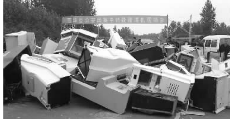
在“打四黑除四害”专项行动中,西华县公安局集中打击了一批赌博窝点,收缴并销毁了大批赌博机。

展以来,全局共查处治安案件42件,抓获违反治安管理人员68人。以打开路,着力强化破案攻坚。西华县公安局紧紧围绕专项行动工作重点,坚持以打开路、先发制敌,向“四黑四害”违法犯罪发起强大攻势,取得显著战果。查处非法行医案件1起,非法制售伪劣、仿冒、有毒有害食品案件7起,抓获犯罪嫌疑人12人;查处非法生产烟花爆竹危险品案件1起,取缔生产窝点1处;配合县文广局取缔黑网吧4家;配合县质监局查处案件6起;查处赌博案件81起(其中查获利用电子游戏机赌博案件36起),查处违法嫌疑人232人,行政处罚232人,立刑事案件1起,刑事拘留2人,收缴、销毁各类赌博机500余台。