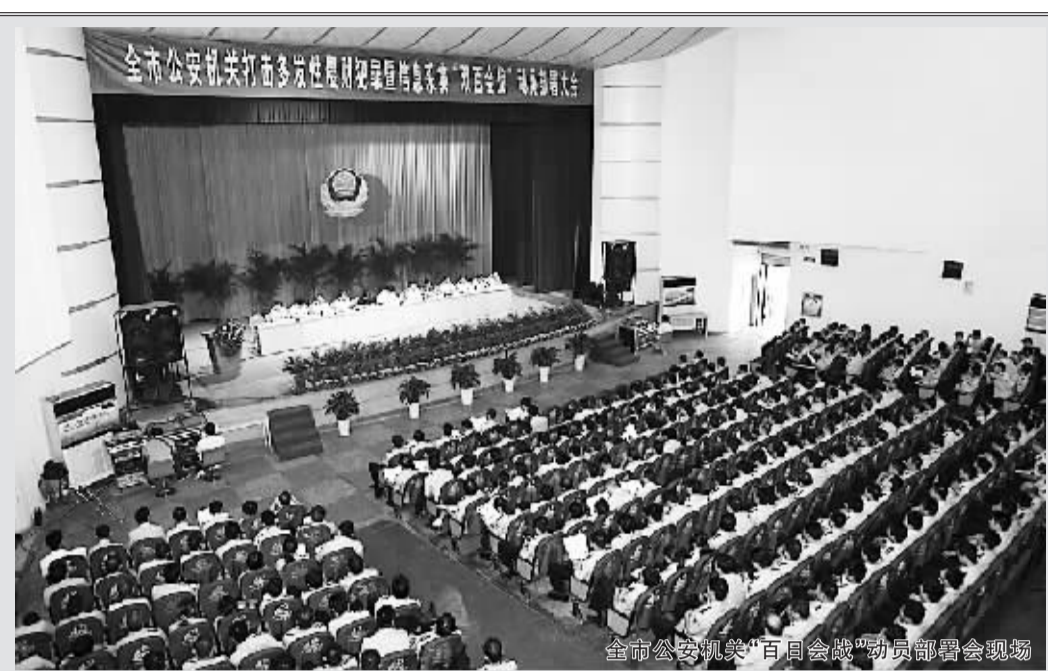
全市公安机关“百日会战”动员部署会现场