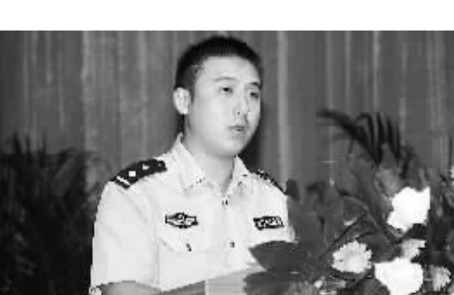
市公安局警务督察支队队长何洪涛发言。