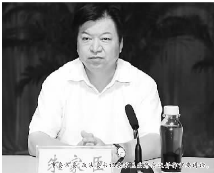
市委常委、政法委书记朱家臣出席会议并作重要讲话。

严厉打击多发性侵财犯罪，历来是维护社会治安大局平稳、保护人民群众生命财产安全的重中之重。对此，市委、市政府对开展打击侵财犯罪“百日会战”十分重视。市委书记徐光、市长岳文海、副市长刘国连听取了市公安局关于深入开展打击侵财犯罪“百日会战”专题汇报之后，明确作出重要指示，要求全市公安机关把会议开好，把战役打好，务必打出声势，打出威风，打出成效，打出亮点，确保全市社会大局稳定。