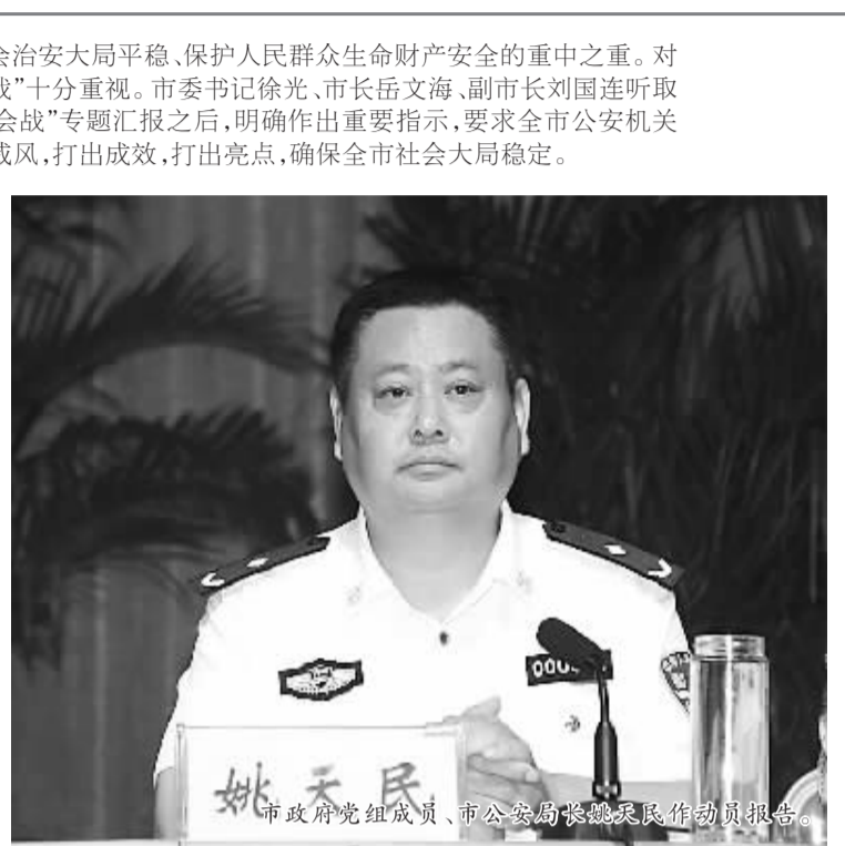
市政府党组成员、市公安局党委副书记姚天民作动员报告。