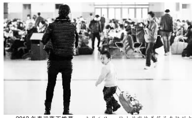
2013年春运落下帷幕 3月6日,一位小旅客拖着箱子在杭州火车站随家人出行。当日是全国春运的最后一天,为期40天的2013年春运落下帷幕。

如果你新婚不久或刚搬入新家,打算为家人添一台无霜冰箱却不知所措;如果你家里的第一台海尔无霜冰箱用了多年,却“喜新厌旧”想以旧换新……这些将不再是你的困扰。近日,海尔冰箱启动“365天有霜无条件退货”活动,让广大市民在获得幸福无霜生活体验的同时,享受海尔一流的品质和服务,在市场上掀起新一轮的无霜冰箱热潮。