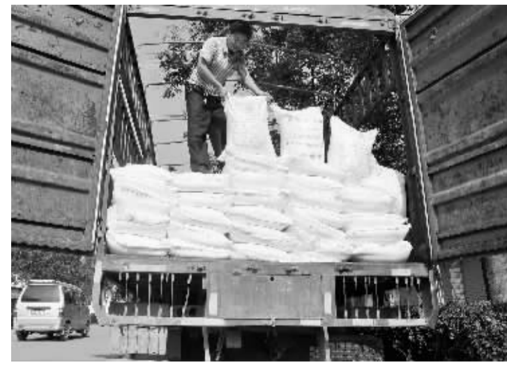
7月21日,商水县盐务局执法人员在公安机关配合下,成功查获一辆私盐贩运车,现场查获28吨私盐。经省盐产品质量检测中心检验,判定该批私盐产品为不合格加碘食盐。目前,案件正在进一步审理中。