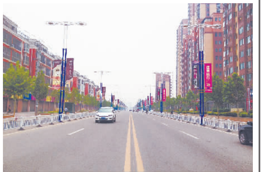
改造后的文昌大道，成为城市东西中轴线。

2008年春，周口市政府、川汇区政府拉开了文昌大道改造的序幕，将其作为重点民生工程进行有序规划、拆迁、建设。周口从来没有一条道路像文昌大道这样备受关注：它是连接