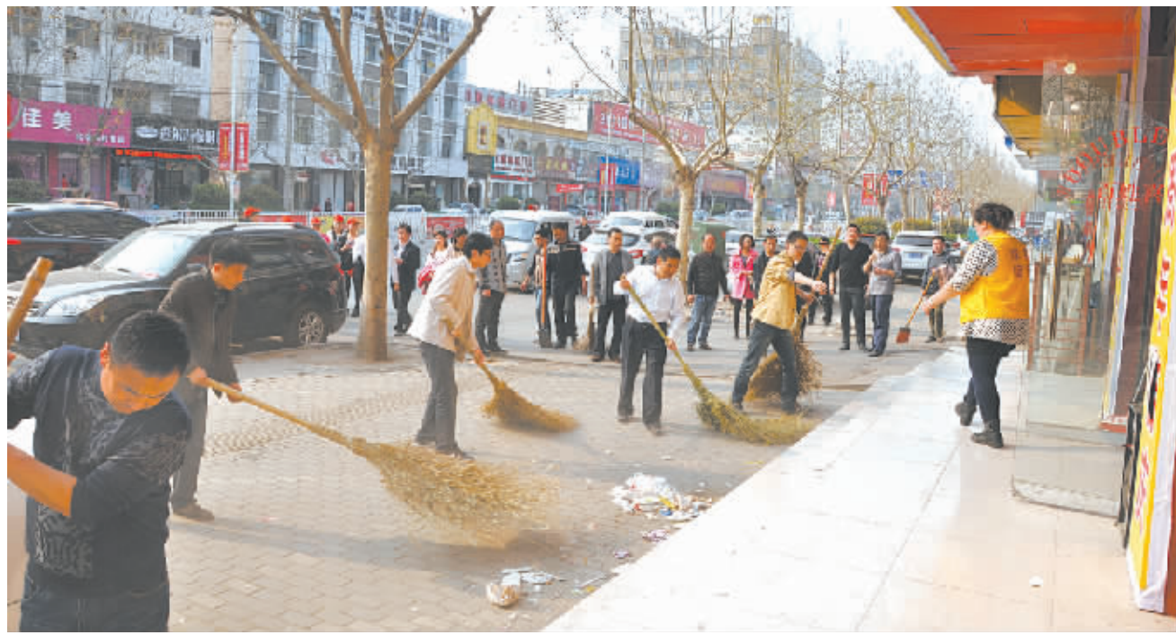
川汇区各单位干部职工走上街头义务打扫卫生。