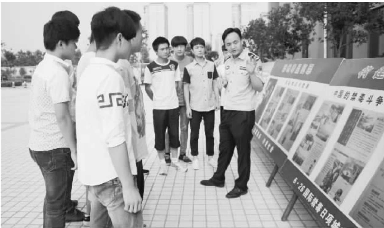
昨日,项城市举办了预防青少年违法犯罪宣传教育活动,邀请该市公安局、检察院、法院、司法局、团市委相关科室负责同志举办专题讲座,有效提高了青少年学生的法律意识,受到社会各界的好评。图为活动现场一角。

针对当地农业基础设施落后的状况,公司利用国内成熟的建设高标准粮田的做法和经验,按照“旱能浇、涝能排、渠相通、路相连”的标准,大力开展农田基础设施建设,推广优良品种、土壤深松改良、配方施肥、膜下滴灌、水肥一体化、合理密植等技术措施,实现良种良法配套、农机农艺结合,有效提高了粮食等农作物生产能力,改进农产品品质。目前公司在塔吉克斯坦哈特隆州亚湾区实施水肥一体化膜下滴灌棉花4500亩、玉米1950亩,长势喜人,预计棉花亩产800斤,玉米亩产1500斤。(钱国顺 陈心成)