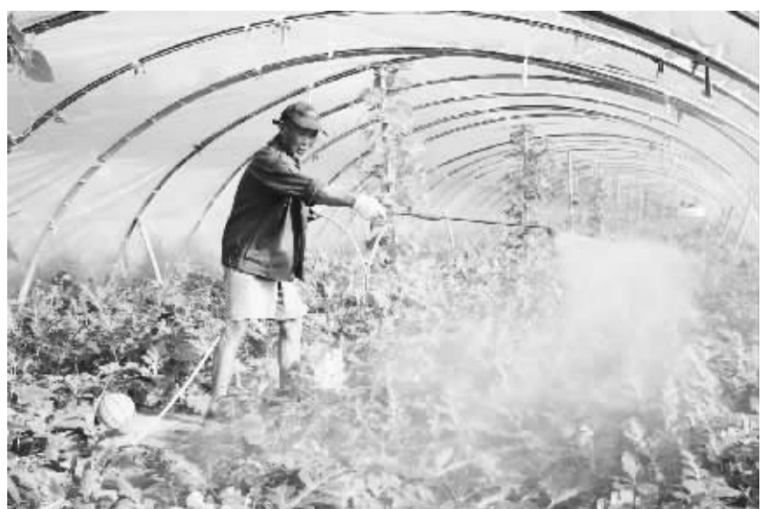
项城市南顿镇按照“优质、高产、高效、生态、安全”的现代农业发展要求,加大政府引导力度,推进农业产业结构调整,培育了中药材、果蔬、食用菌等特色农业,促进了农民增收、农业增效,带动了全镇经济健康发展。图为该镇农民正在为大棚西瓜喷雾保湿。