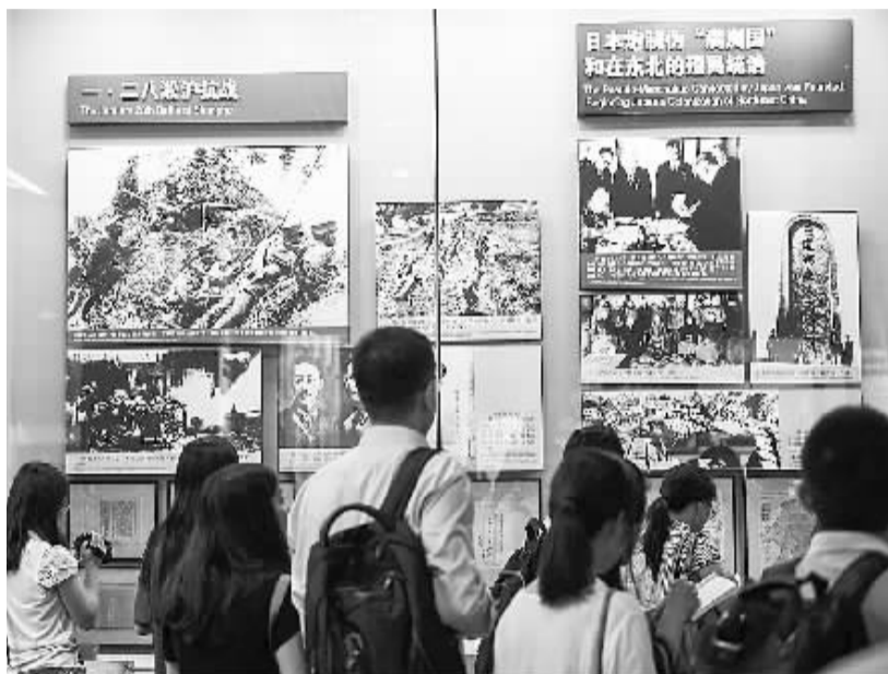
纪念中国人民抗日战争暨世界反法西斯战争胜利70周年主题展览在京开幕

7月7日,“飞虎邮局”工作人员展示专门制作的“飞虎明信片”和“飞虎邮票”。当日,为纪念抗日战争时期美国飞虎队在重庆帮助中国军民抗击日本空军的历史,重庆飞虎队展览馆在当地邮政部门的批准下成立了首家“飞虎邮局”。