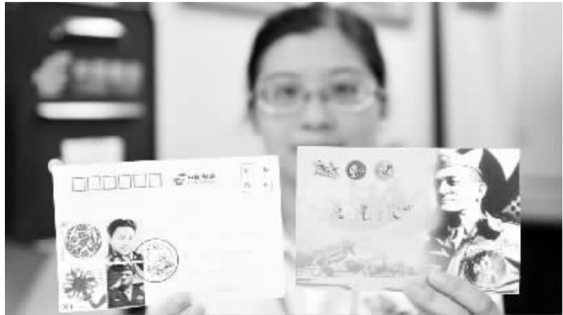
重庆成立“飞虎邮局”纪念抗战

7月7日,参加福州“抗日烈士纪念馆”奠基仪式的抗日烈士在奠基仪式上合影。当日,福州市有关部门和抗日老兵代表及后人一起举行福州“抗日烈士纪念馆”奠基仪式。纪念馆由手模铜雕、抗日烈士芳名、长明火雕塑等组成,旨在让世人永远铭记为抗日战争胜利做出贡献的烈士。