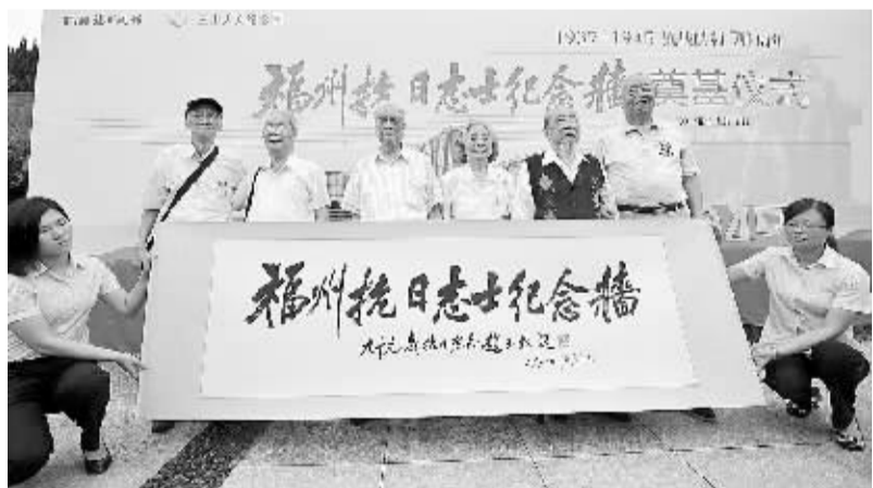
福州举行“抗日烈士纪念馆”奠基仪式

7月7日,抗战老兵和南昌市珠市小学的孩子们一同参观展览。当日,数位抗战老兵及其后代、社会各界群众来到南昌八一起义纪念馆参观《八路军总部在太行山》图片展,重温抗战历史,缅怀革命先烈。