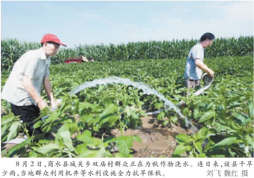
8 月 2 日,商水县城关乡双庙村群众正在为秋作物浇水。连日来,该县干旱少雨,当地群众利用机井等水利设施全力抗旱保秋。

淮阳：『筑巢引凤』留住卫生人才 订单定向医学生就业安置工作经验全国推广 本报讯（记者 刘艳霞 通讯员 王学平）“基层医院想留住人才很难,我们的做法是‘筑巢引凤’,为订单定向医学生创造良好的回归条件和干事环境,让他们‘下得去、留得住、上得来、有前途’。今年,我们首批毕业的 9 名农村医学定向生全部回到家乡就业。”由国家卫生计生委、教育部举办的全国农村订单定向医学生免费培训暨就业工作电视电话会议日前在北京举行,淮阳县卫生局局长程东升在会上就订单定向医学生就业安置工作向参会人员作典型经验介绍。 近年来,淮阳县按照“保基本、强基层、建机制”的医改基本原则,在财力不足的情况下,持续加大农村卫生投入力度,虽然使基层医疗卫生机构基础设施建设不断加强,硬件设施不断完善,但是以人才队伍为重点的软件建设仍相对落后,医学院校本科生下不来、留不住的现象十分严重,成为制约全县卫生事业发展的“瓶颈”。 为改变基层医疗单位人才匮乏的现象,淮阳县采取多种形式、通过多种途径,切实加强基层卫生人才培养。2010 年,国家发改委等 5 部委出台《关于开展农村订单定向医学生免费培养工作实施意见》,省政府出台《河南省农村卫生人才队伍建设工程实施方案》。当年暑期,第一届农村订单定向医学免费生招生时,淮阳县卫生局与 9 名学生签订协议书,分别送到郑州大学、河南科技大学、河南中医学院、新乡医学院 4 所河南知名高校学习深造。 人才送出去了,关键在于“回收”。为此,淮阳县采取多项措施,积极“筑好巢”,努力“留住凤”。“筑好巢”,即为医学生提供良好回归环境。淮阳县卫生局成立订单定向免费医学生入职及住院医师规范化培训衔接工作领导小组;严格履行协议,规范衔接流程,指导基层医疗卫生机构按有关规定与之签订聘用合同、办理相关手续、落实相关待遇、开展岗前培训,确保各项政策依法落实到位;加强履约管理,明确处罚措施,对免费医学毕业生就业和规范化培训工作情况落实不到位的按照国家要求追究有关人员责任,并要求各级医疗卫生机构不得聘用违约人员,各培训基地不得招录违约人员参加住院医师规范化培训。“留住凤”,即创造良好环境留住人才。一是待遇留人。毕业生服务期内依法享受法律政策规定的节假日、公休假、工资福利待遇、医疗、养老社会保障等。妥善安排毕业生的食宿,并配备必要生活用品。参加住院医师规范化培训期间,单位要按月发放生活费。二是政策留人。取得《住院医师规范化培训合格证书》的免费生,优先纳入全科医师特岗计划,并在开展或参加各类业务培训时优先安排。注册全科医师后,可提前一年晋升中级职称。晋职时放宽硬性规定,把接产量、服务质量、群众满意度作为免费生职称晋升的重要因素。三是事业留人。淮阳县卫生局要对订单定向免费生制定专门考核办法,对其进行单独考核,并对考核内容、评分办法、结果运用等作出明确规定,让毕业生感到工作有压力、学习有动力、干好有奔头,确保毕业生既“下得去、留得住”,又“上得来、有前途”。四是感情留人。淮阳县卫生局领导班子成员和免费生建立“一对一”帮扶制度,及时了解毕业生的思想状况、工作情况,帮助他们解决家庭、生活和工作中的实际困难和问题,消除他们的后顾之忧。 今年夏季,淮阳县首批农村订单定向医学生毕业后,9 名学生全部回到家乡工作,为全县卫生事业补充了新鲜血液。由于淮阳县订单定向医学生就业安置工作走在了全市、全省乃至全国前列,其经验在全国推广。