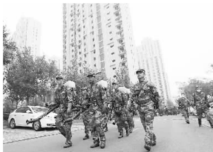
国家核生化应急救援队进入居民区进行洗消作业 8月18日,国家核生化应急救援队官兵在海港城等事故核心区周边居民区开展洗消作业。8月12日,天津瑞海公司危险品仓库发生特别重大火灾爆炸事故。