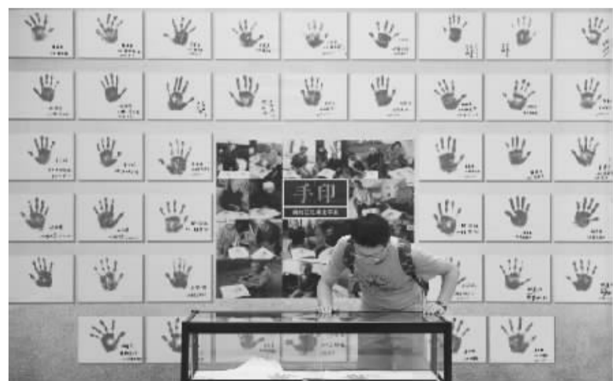
杭州举办幸存慰安妇图片实物展 8月18日,参观者在参观展出的慰安妇幸存者手印。当日,为纪念抗日战争胜利70周年,由杭州图书馆、杭州图书馆事业基金会主办的70位国际幸存慰安妇图片、实物展开展,展出中国、韩国等地的70位慰安妇幸存者的肖像照、日常物品和手印等展品。

市长张工指出,8月28日0时至9月4日24时,京、津、冀、晋、蒙、鲁、豫七省区市将统一实施临时强化减排措施,确保期间区域主要污染物排放同比减排30%以上,北京市减排量达到40%以上。一揽子措施针对燃煤、机动车、工业、扬尘等领域。七省区市的燃煤电厂作为重点控制对象,通过停产检修、减压发电负荷等措施,实现污染减排。北京全市域实施机动车单双号行驶、公务用车停驶80%。