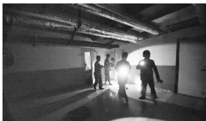
民兵进入海港城等地下空间巡查 8月18日,天津汉沽人民武装部民兵进入天津港瑞海公司危险品仓库特别重大火灾爆炸事故周边的海港城小区地下空间巡查。