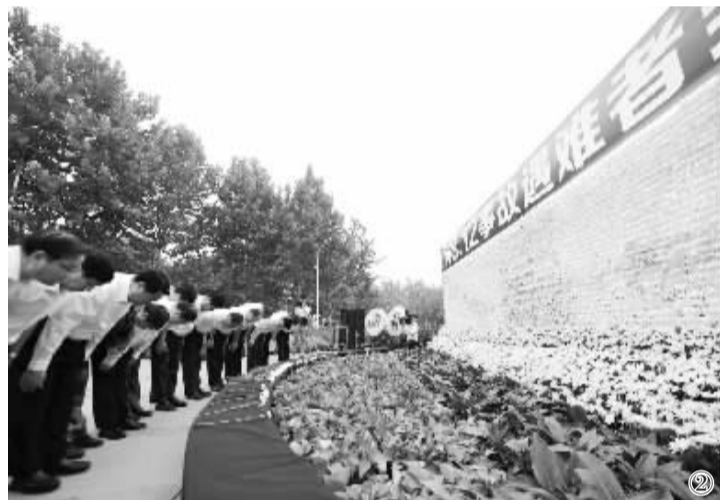
8月18日,天津港“8·12”特别重大火灾爆炸事故纪念活动在天津举行。图①:天津市和平区南营门街的居民哀悼事故遇难者。图②:社会各界代表在天津市滨海新区京门大道街心公园举行的悼念活动中向遇难者鞠躬。图③:事故中牺牲的消防战士亲属在天津市公安消防支队临时灵堂内悼念。