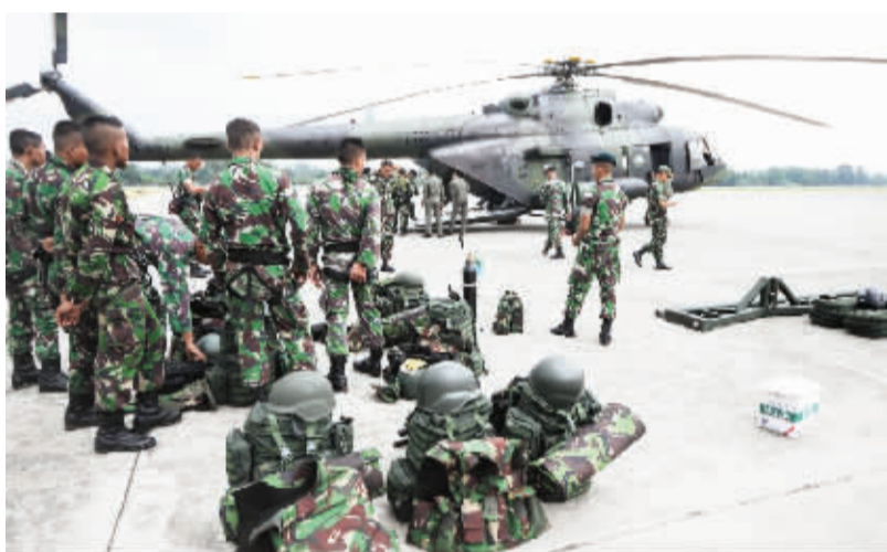
印尼坠毁客机上无人还生 8月18日,在印度尼西亚亚查普拉,士兵准备前往坠机事故现场开展搜救工作。印度尼西亚交通部发言人18日说,搜救人员在巴布亚省印尼特利加那航空公司航班客机坠毁现场发现54具遇难者遗体,机上无人还生。 新华社发

自今年年初被美国媒体曝出在担任公职期间使用私人邮箱和私人邮件服务器处理所有邮件事务以来,希拉里本应畅通无阻的寻求民主党2016年大选党内提名之路便坎坷不断。为防止“邮件门”持续发酵以至影响选情,希拉里本月11日同意向司法部交出其任国务卿期间用来储存所有邮件的私人服务器。