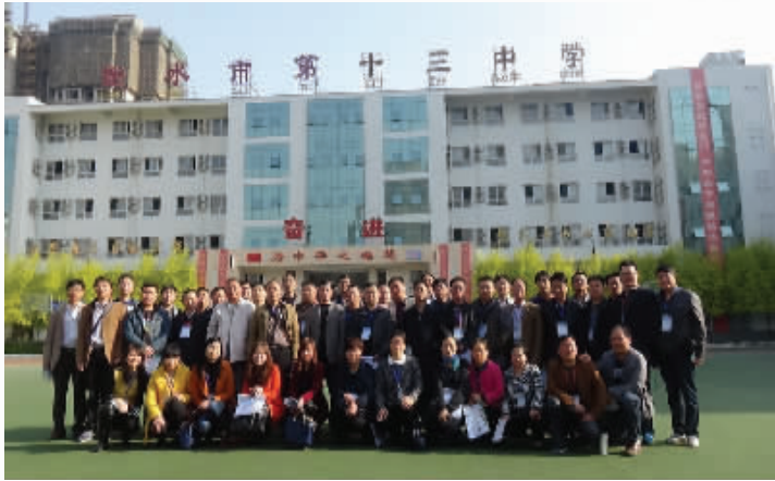
教师代表到河北考察高效课堂建设

成绩较差,自信心就会受挫,是快乐不起来的。陈州高中的学生普遍基础较差,学习吃力。学生多半带着中考受挫的阴影入学,如何建立他们的自信,是学校老师十分关心的一个问题。