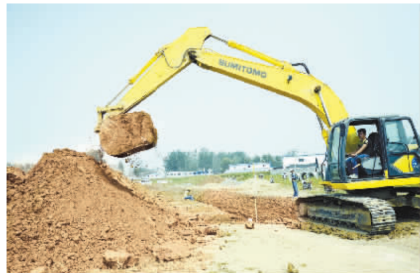
施工人员在沙颍河北岸紧张工作。沙颍河中心城区段两岸开发建设,是沙颍河城区综合治理项目一期工程的一部分,对提升周口城市形象、打造周口城市名片具有重要意义。