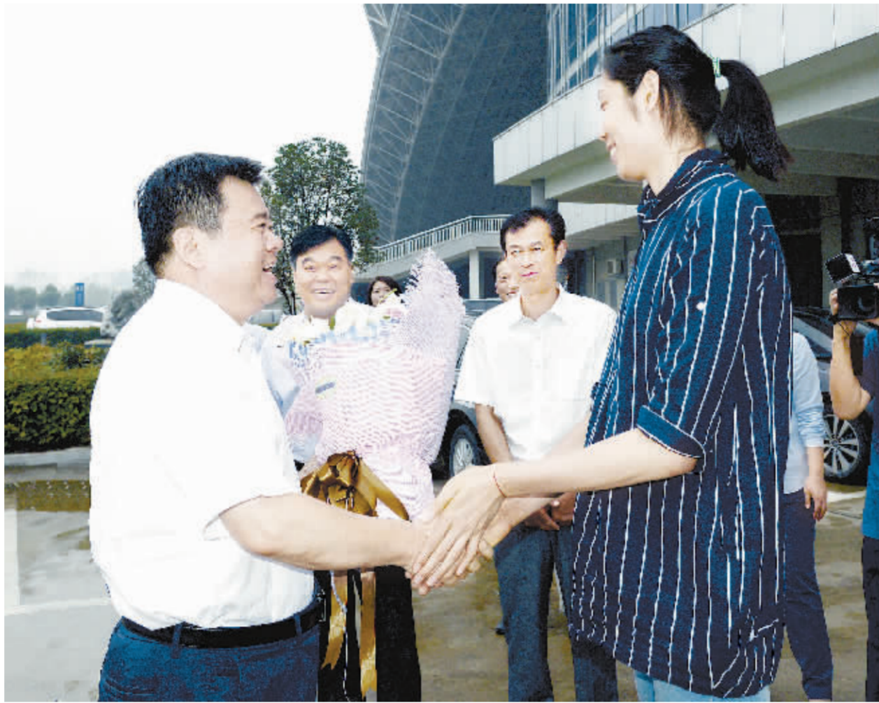
昨日下午,徐光、刘继标等市领导亲切接见了朱婷及其家属。

市委常委、秘书长李云,正市长级干部李绍彬及郸城县、市体育局主要负责同志接见时在座。