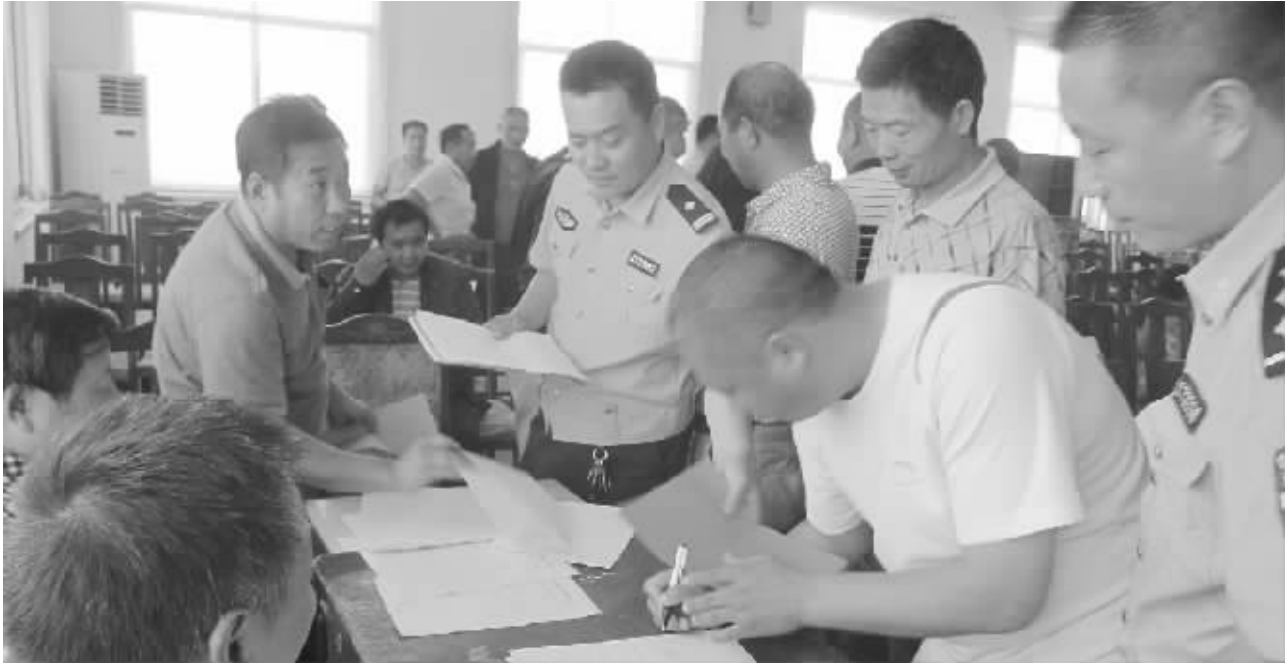
近日,扶沟县公安局交警大队举办校车驾驶员交通安全知识培训班,教育广大校车驾驶员要文明驾车、安全出行,进一步增强全县校车驾驶员的交通安全意识,防止意外安全事故的发生。图为校车驾驶员在签订《交通安全责任书》。

位加大人力物力投入力度,增强了脑卒中患者的救治力度,但是医疗单位在患者的康复治疗方面仍然存在着设备投入不足的问题。此次捐赠正好弥补了这方面的不足,真正起到了雪中送炭的作用,为我市广大中风患者的康复治疗带了福祉,送来了健康。”受赠医院负责人表示。