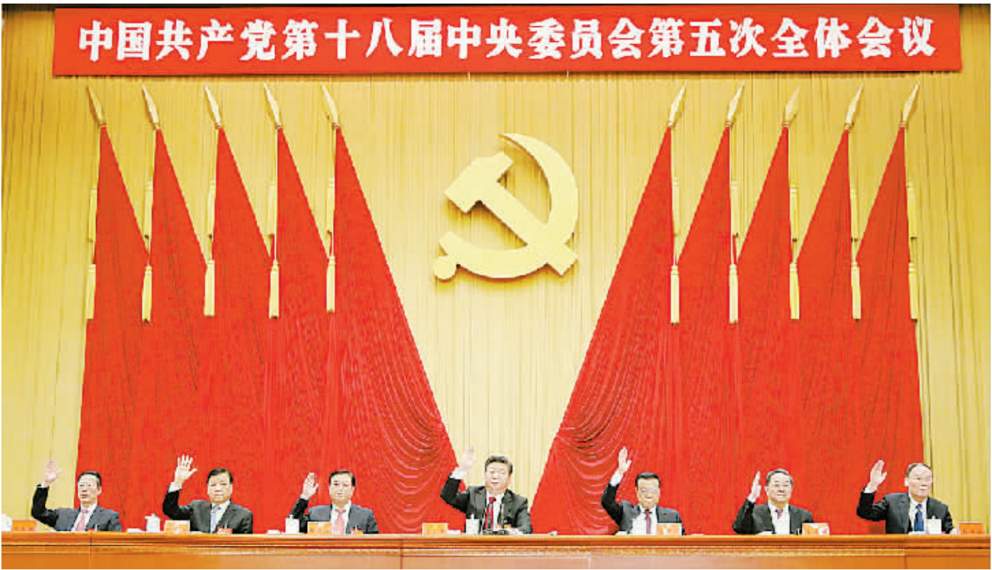
中国共产党第十八届中央委员会第五次全体会议,于2015年10月26日至29日在北京举行。这是习近平、李克强、张德江、俞正声、刘云山、王岐山、张高丽等在主席台上。

中国特色社会主义伟大旗帜,全面贯彻党的十八大和十八届三中、四中全会精神,以马克思列宁主义、毛泽东思想、邓小平理论、“三个代表”重要思想、科学发展观为指导,深入贯彻习近平总书记系列重要讲话精神,团结带领全党全军全国各族人民,坚持“四个全面”战略布局,坚持统筹国内国际两个大局,坚持稳中求进工作总基调,积极引领经济发展新常态,着力推进改革开放,加强和创新宏观调控,有效化解各种风险和挑战,保持经济平稳较快发展和社会和谐稳定,开