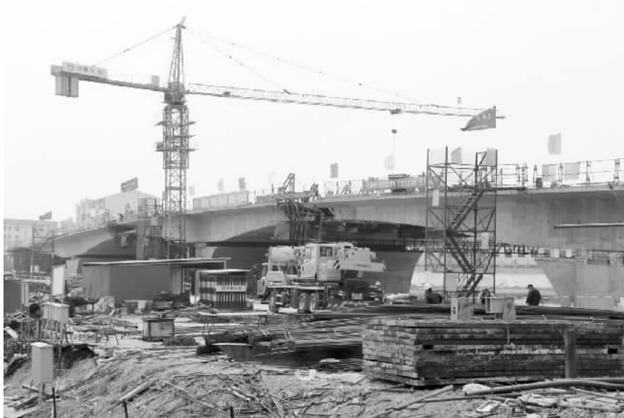
3月27日,扶沟县贾鲁河东关大桥正在加紧施工建设。该桥是扶沟城市基础设施发展项目,桥长213米,宽26米。大桥建成通车后,将进一步完善城市交通架构,对加快城市化进程起到重要作用。

“家乡的快速发展,离不开全县人民的拼搏努力,离不开沈丘籍企业家的鼎力支持。沈丘县将继续发挥这种人脉资源优势,积极与在外成功人士洽谈合作,通过与他们加强沟通交流,从而吸引更多的沈丘籍企业家回乡创业。”该县商务局局长孙伟说。