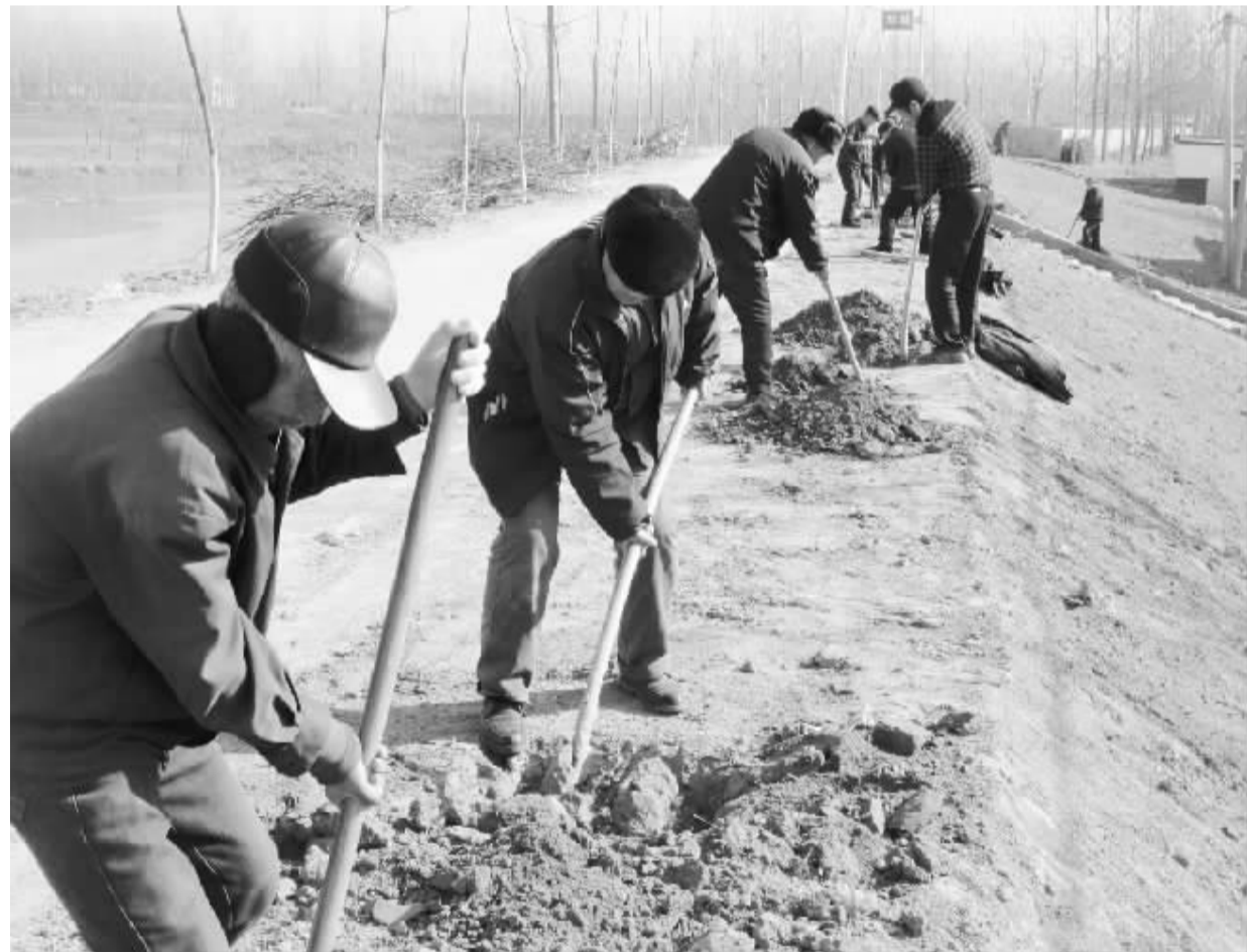
近日,商水县邓城镇的群众正在沙河堤上挖树坑。春暖花开之际,邓城镇党委、镇政府积极组织全镇干部群众植树造林高潮,已新栽树苗4万多棵。