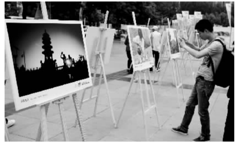
首届河南乐活旅游展开幕 5月23日,观众在首届河南乐活旅游展开现场欣赏中原旅游微摄影大赛图片展。当日,2016中国(郑州)世界旅游城市市长论坛活动之一的首届河南乐活旅游展在郑州拉开帷幕。