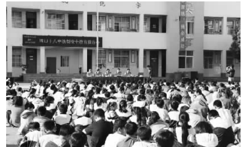
5月16日,市公安局荷花分局组织社区民警到周口十八中举办法制安全教育报告会。民警结合近年来典型的青少年犯罪案例,教育学生如何预防犯罪,如何提高自我防范能力,受到师生一致好评。

不久前,扶沟县公安局非园派出所民警走访时了解到楚老汉家里的情况,研究决定尽快帮楚老汉的女儿解决户口问题。由于女儿“黑户”时间较长,无法找到当年的原始资料。该所一方面向上级主管部门汇报情况,另一方面组织民警到其户籍所在地调查取证。民警走访多名村干部,翻阅大量相关材料,询问10多位群众,最终形成完整的证据链。 随后,民警将调查材料上报县公安局户政部门,户政部门认真审核后,将相关手续上报到市公安局,在相关部门的共同努力下,楚老汉女儿的户口手续顺利审批过关。该所户籍警第一时间为她办理了入户手续。